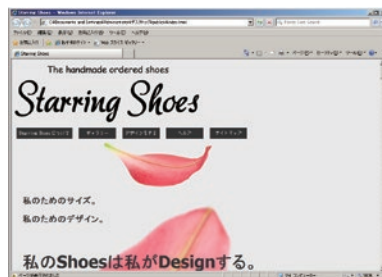
↑ 修了生による作品 ▶